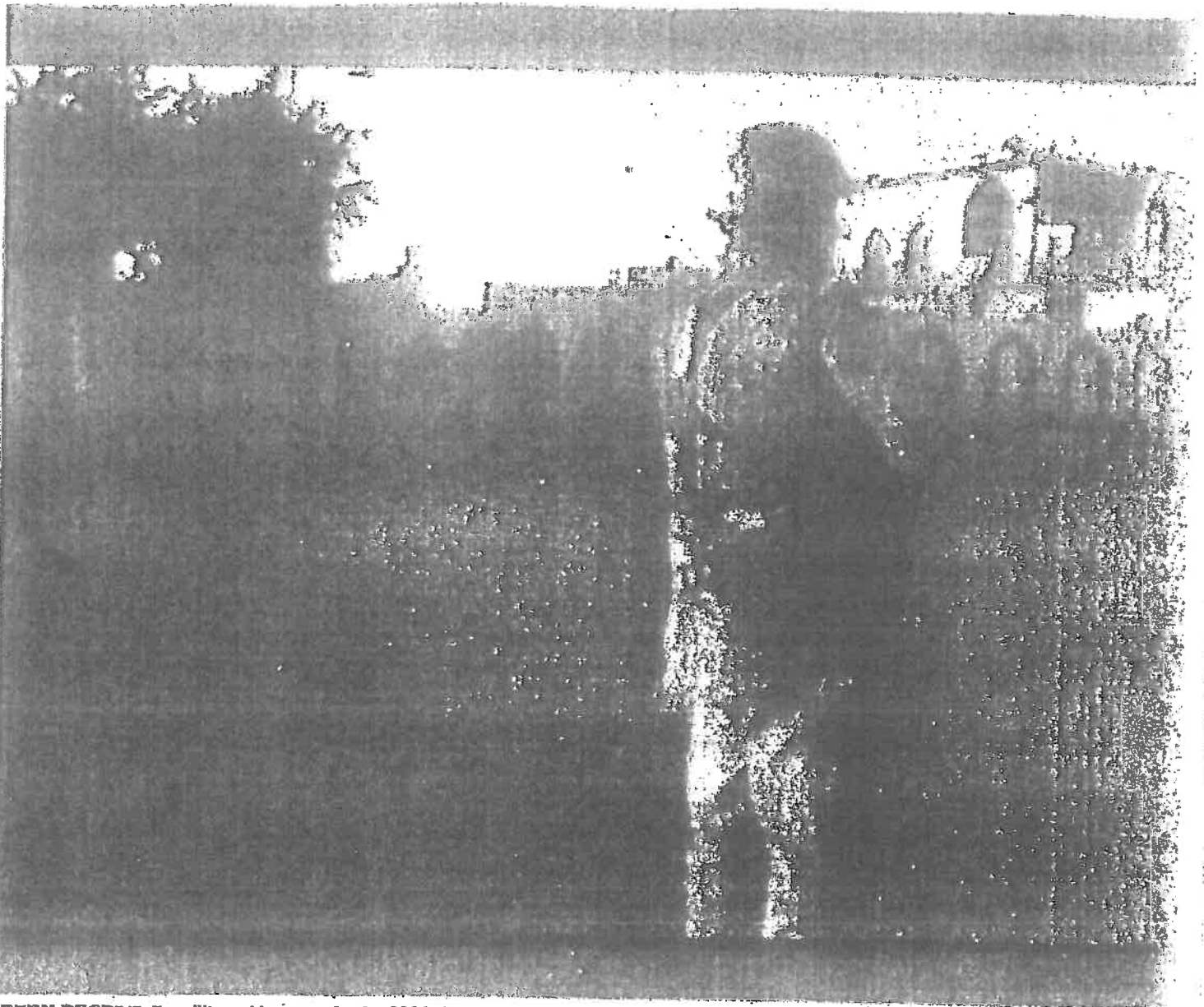
GREEN DESERT. En militær videooptagelse fra 2004 viser, at en dansk bataljon ad flere omgange overdrog i alt mindst 23 sunni-muslimer til shia-militseren i Basra-området. De overdragne blev højest sandsynligt udsat for tortur, skriver Christen Sørensen. Foto fra den militære videooptagelse.